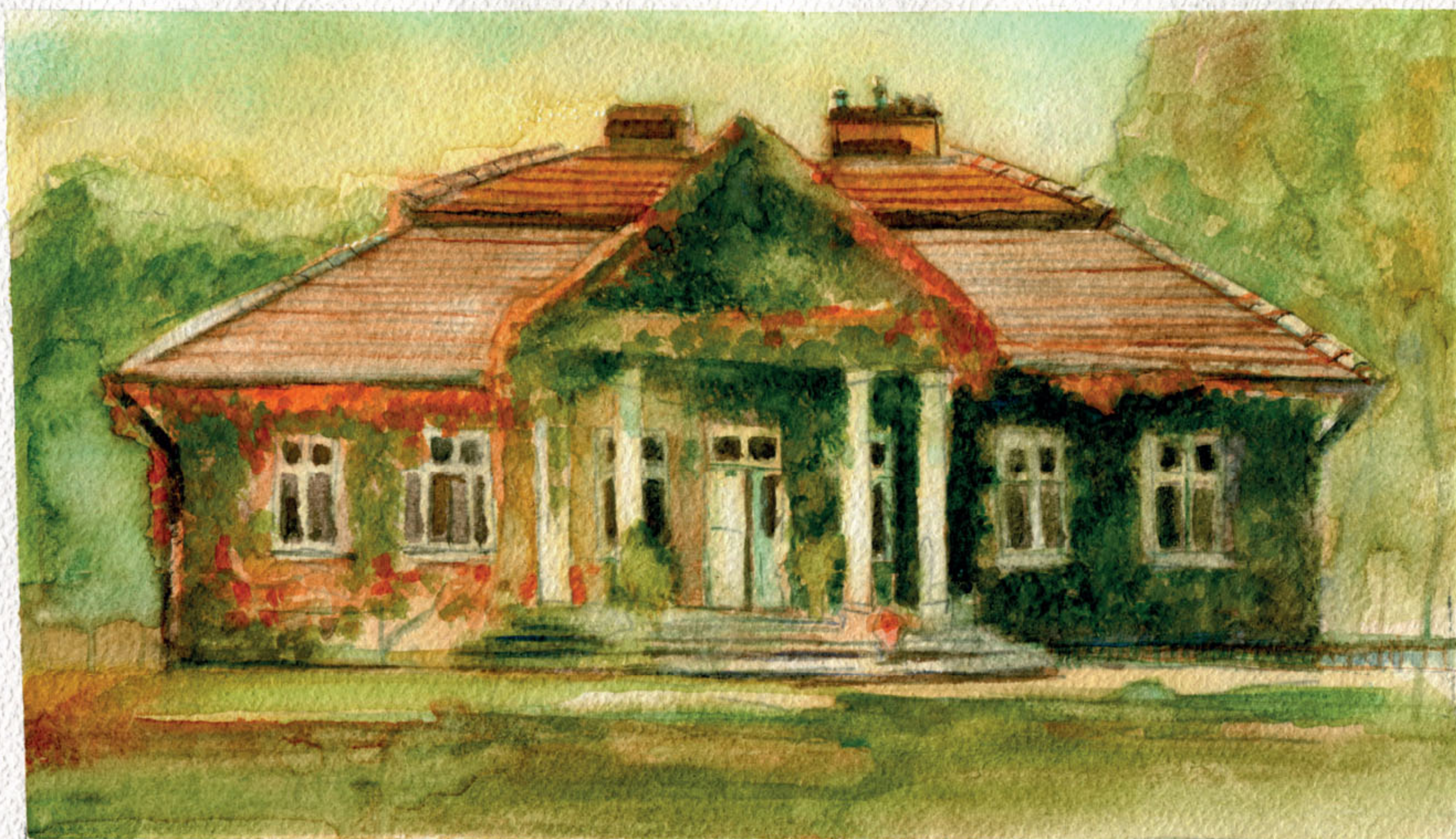
Dworek ordynacji Potockich w Dąbrówkach