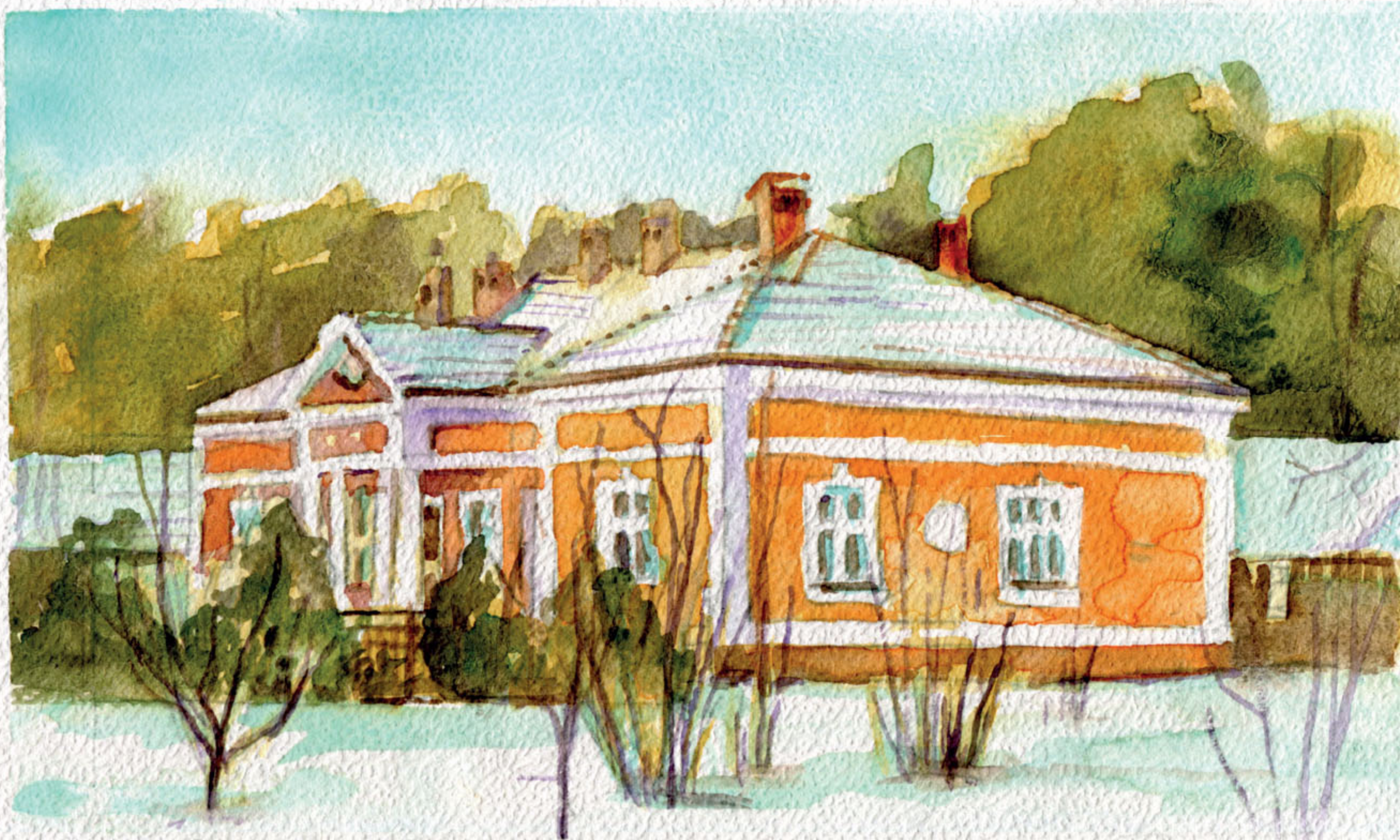
Leśniczówka z 1934 r. w Czarnej