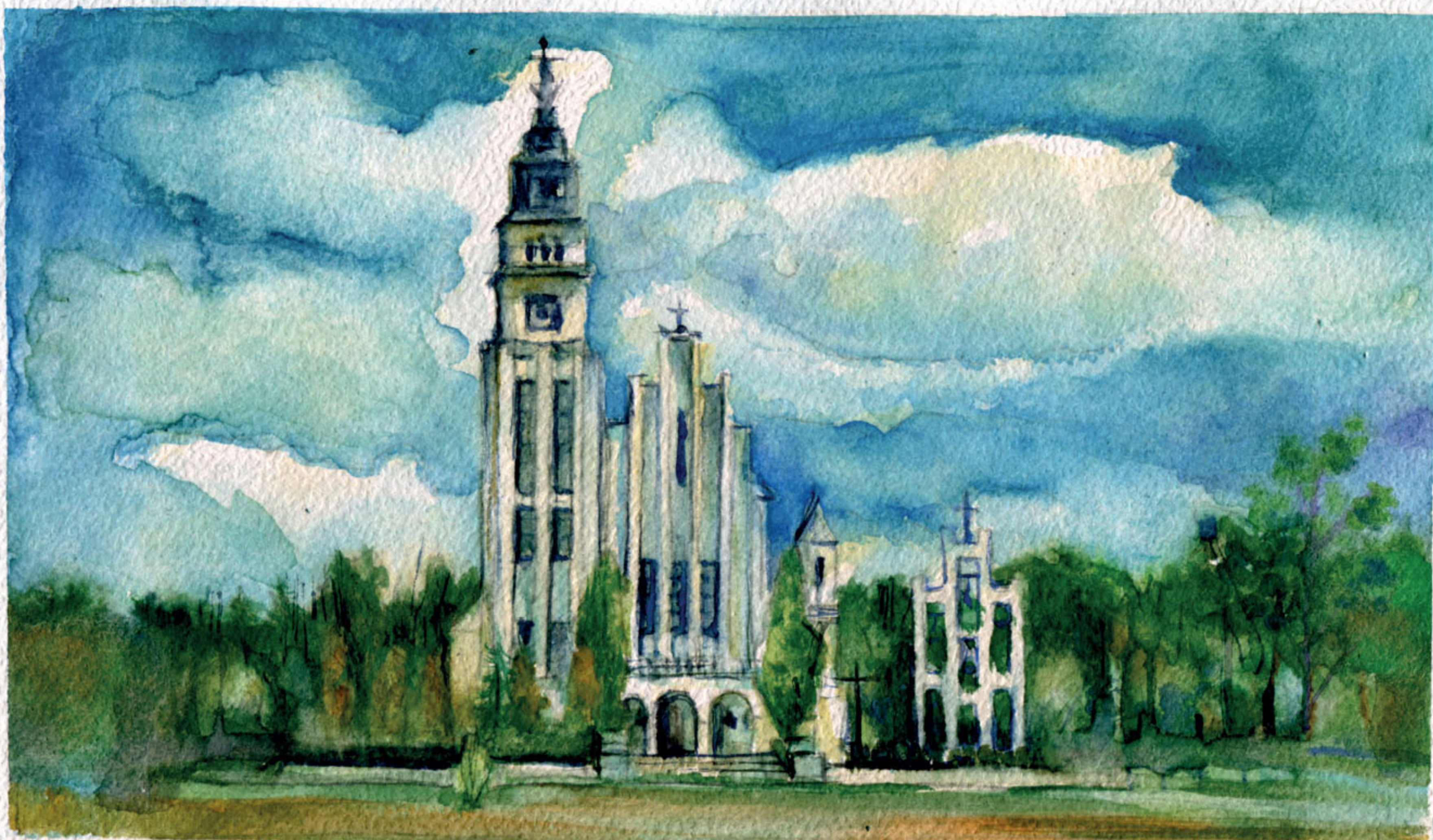
Kościół pw. Nawiedzenia NMP w Medyni Głogowskiej