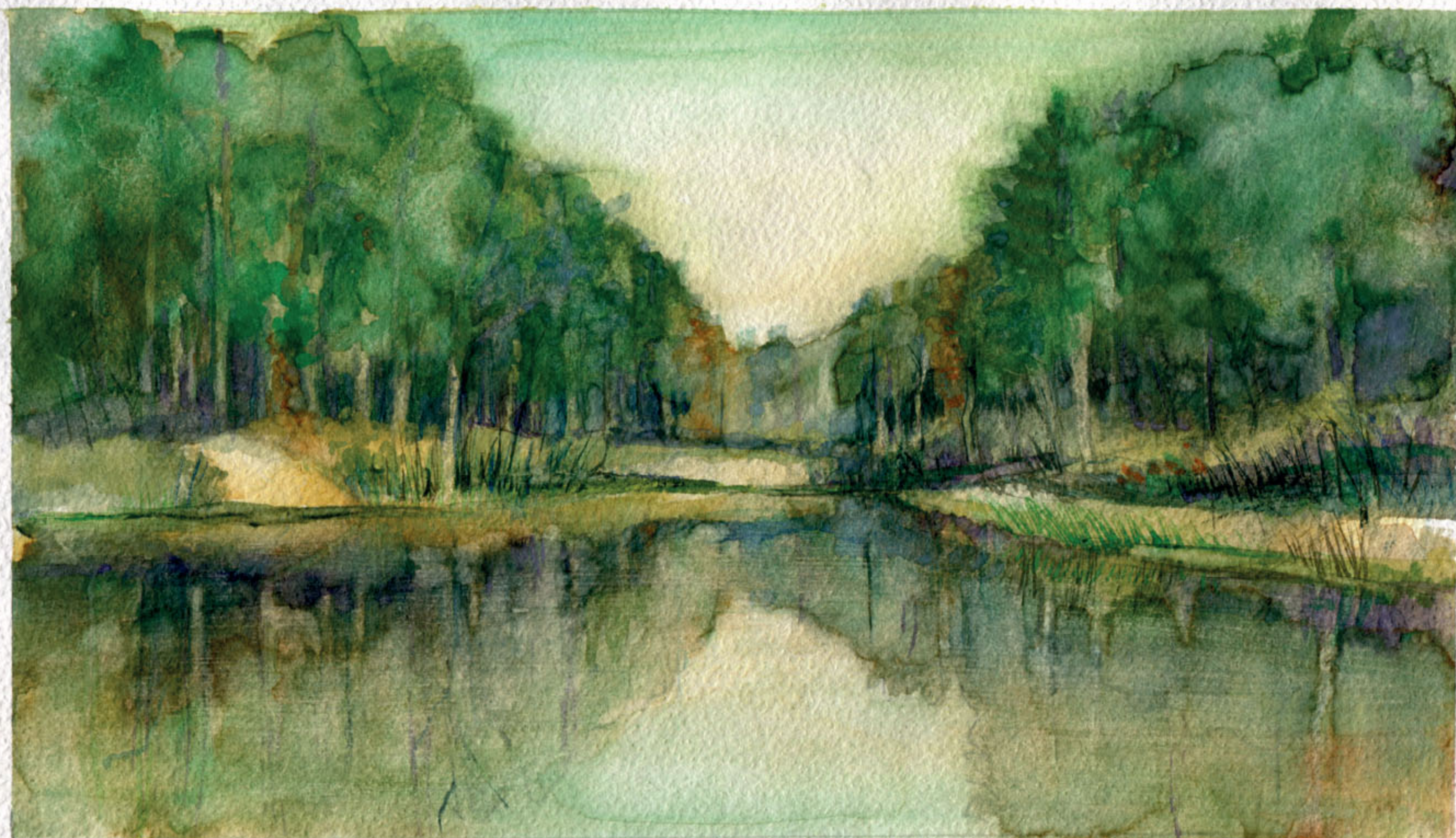
Dolina Pięciu Stawów w Zalesiu