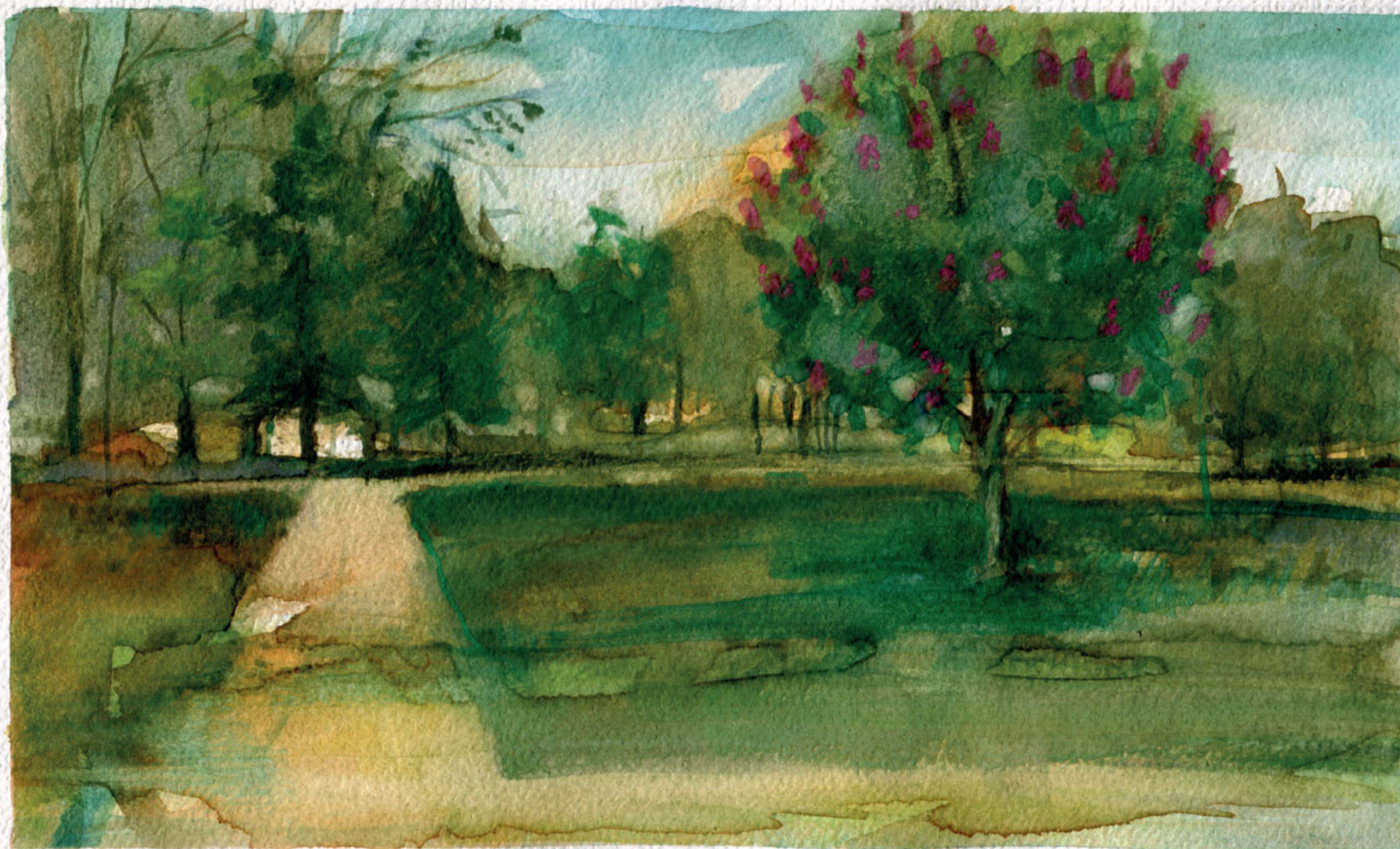
Ogród Jordanowski w Woli Matej