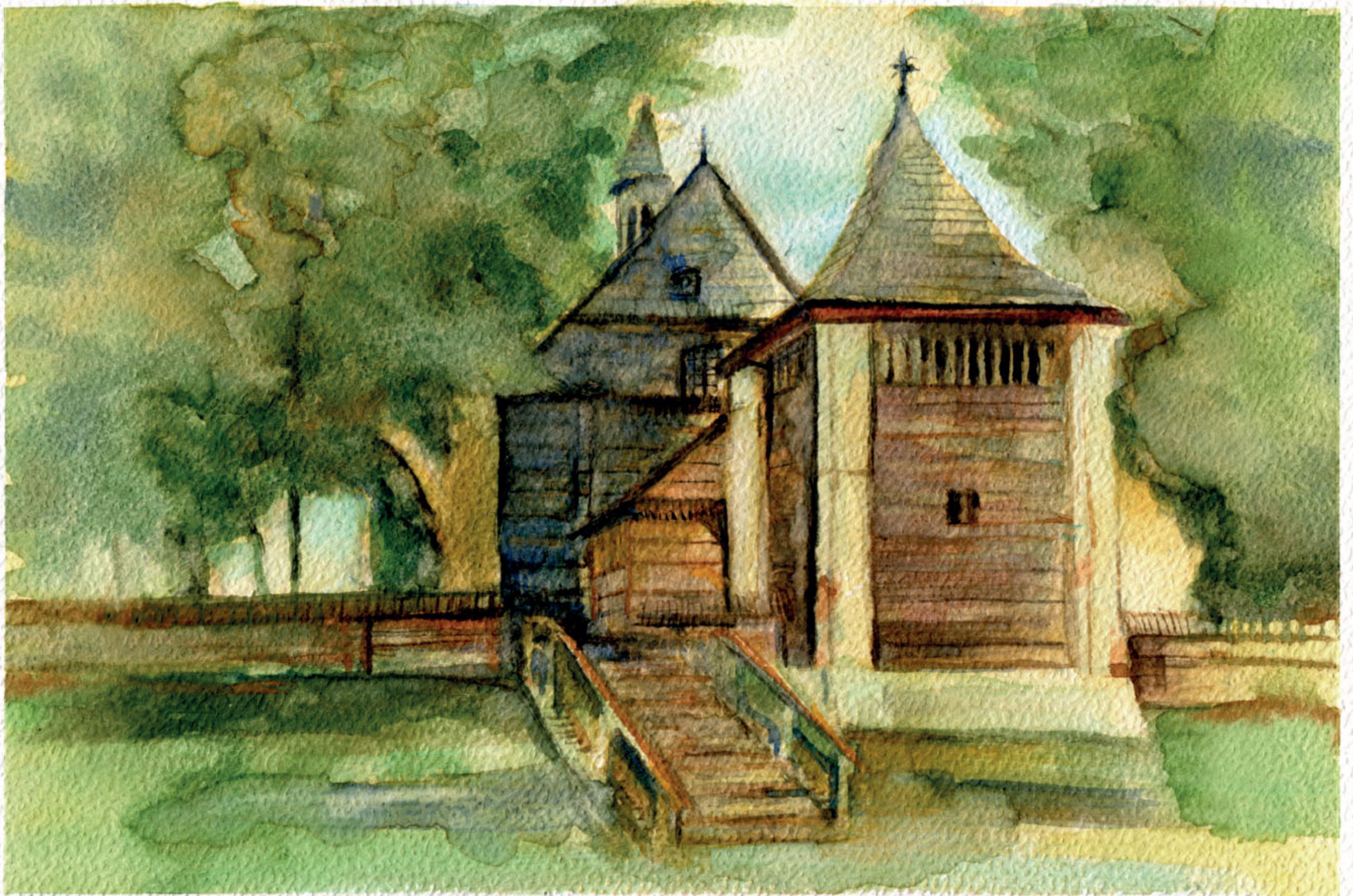
Kościół św. Jakuba w Krzemienicy