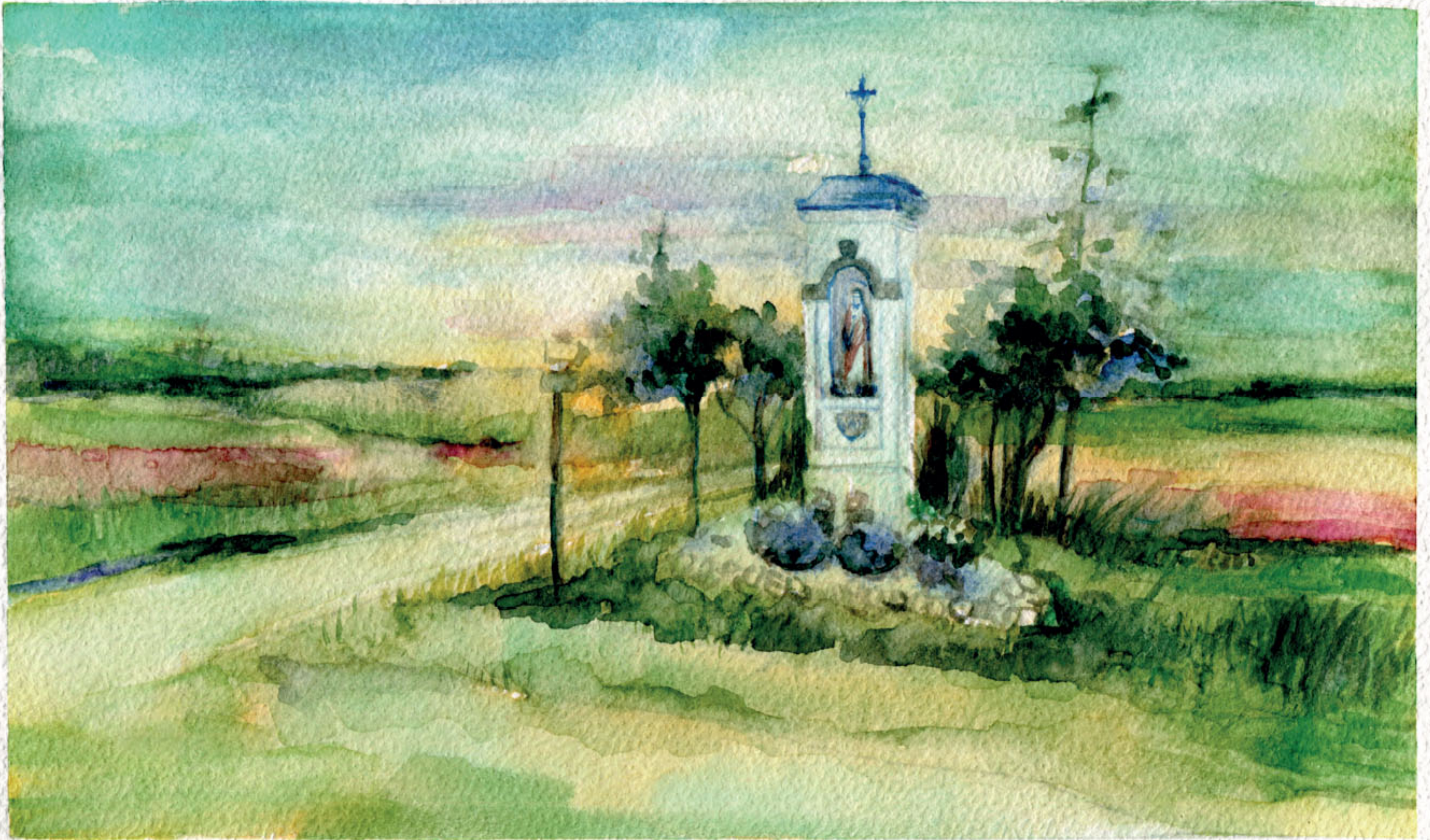
Kapliczka Serca Jezusowego w Zalesiu