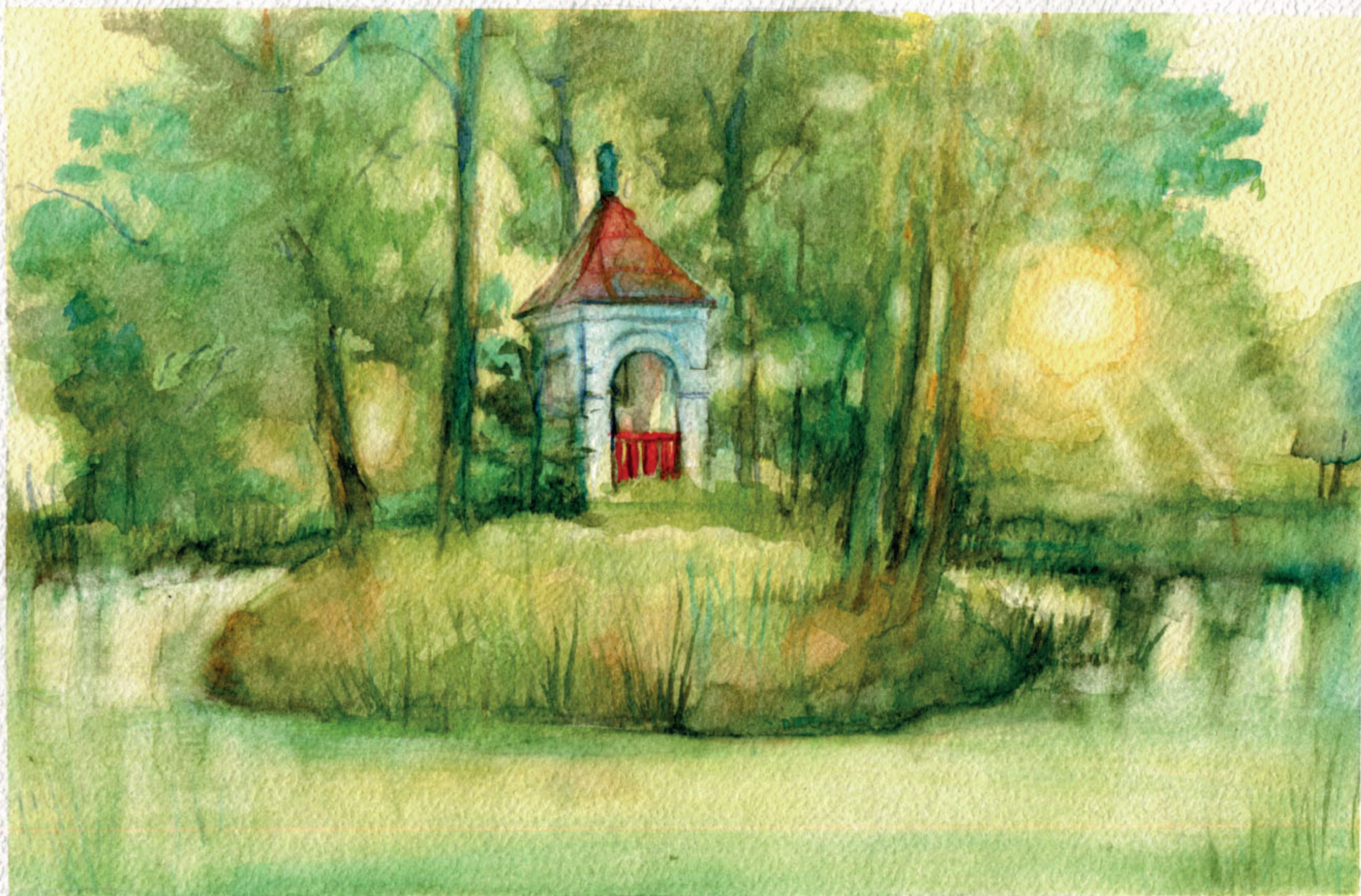
Kapliczka na stawie w Krzemienicy