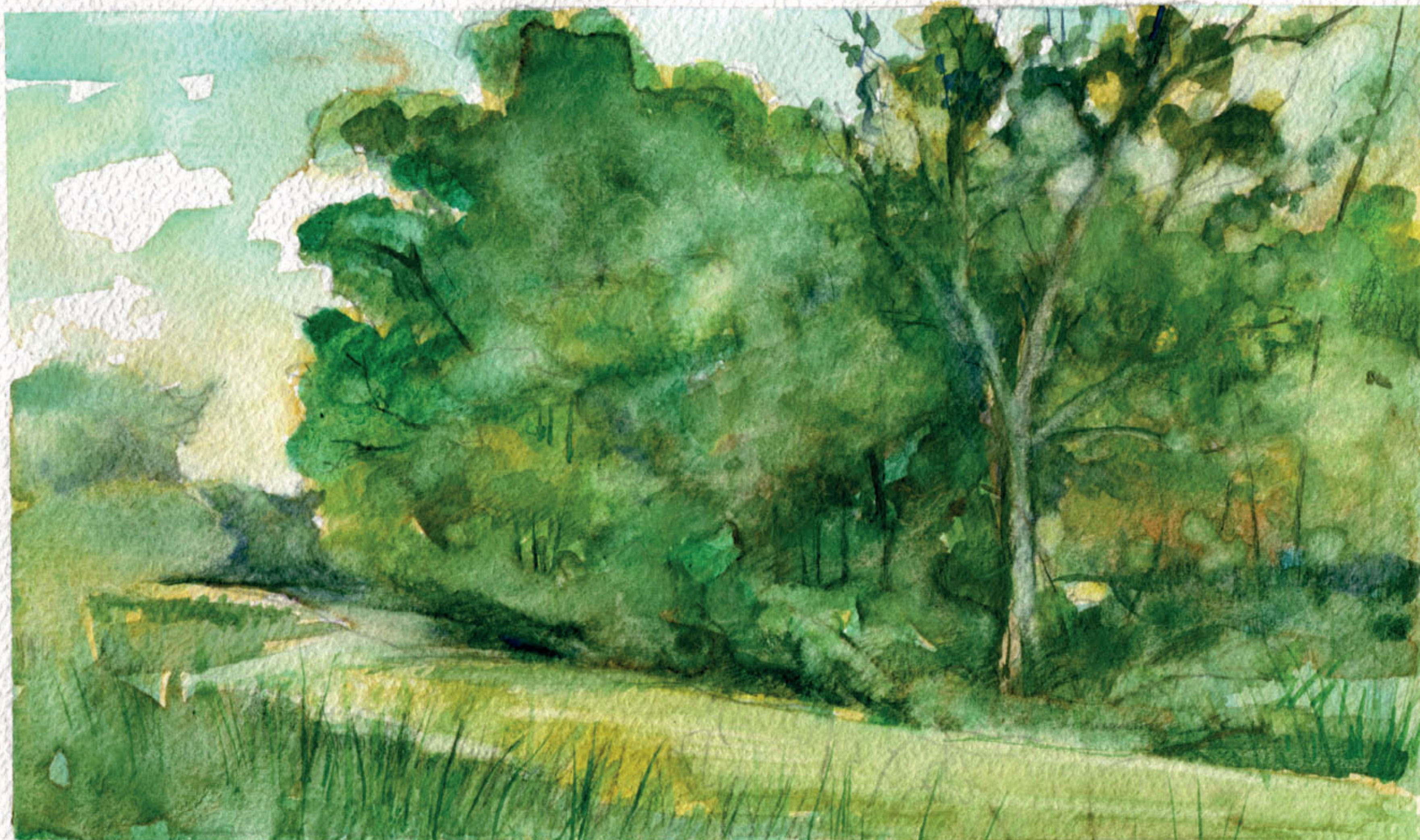
Starorzecze Wisłoka w Woli Małej