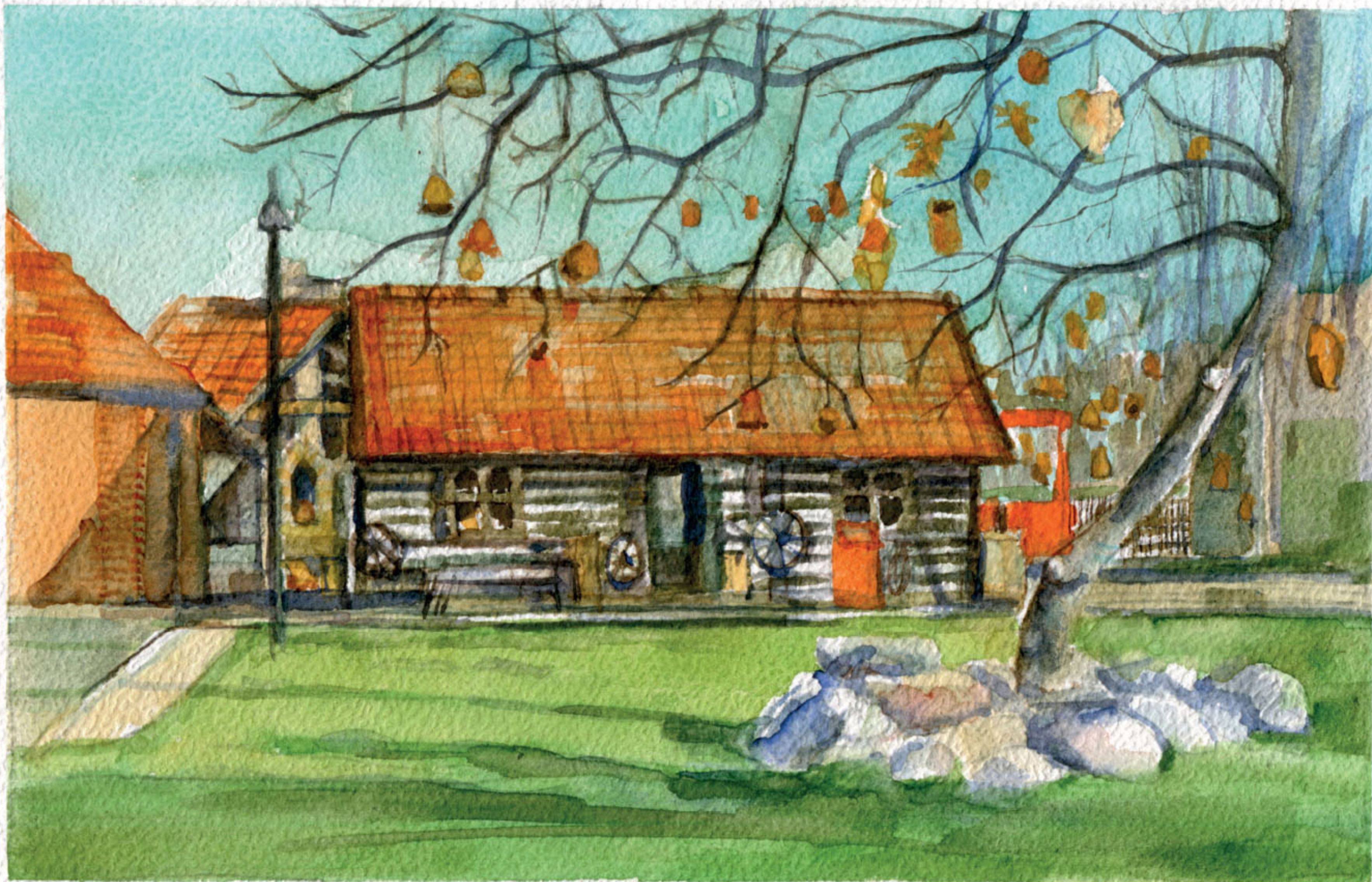
Ośrodek Garncarski „MEDYNIA” w Medyni Głogowskiej