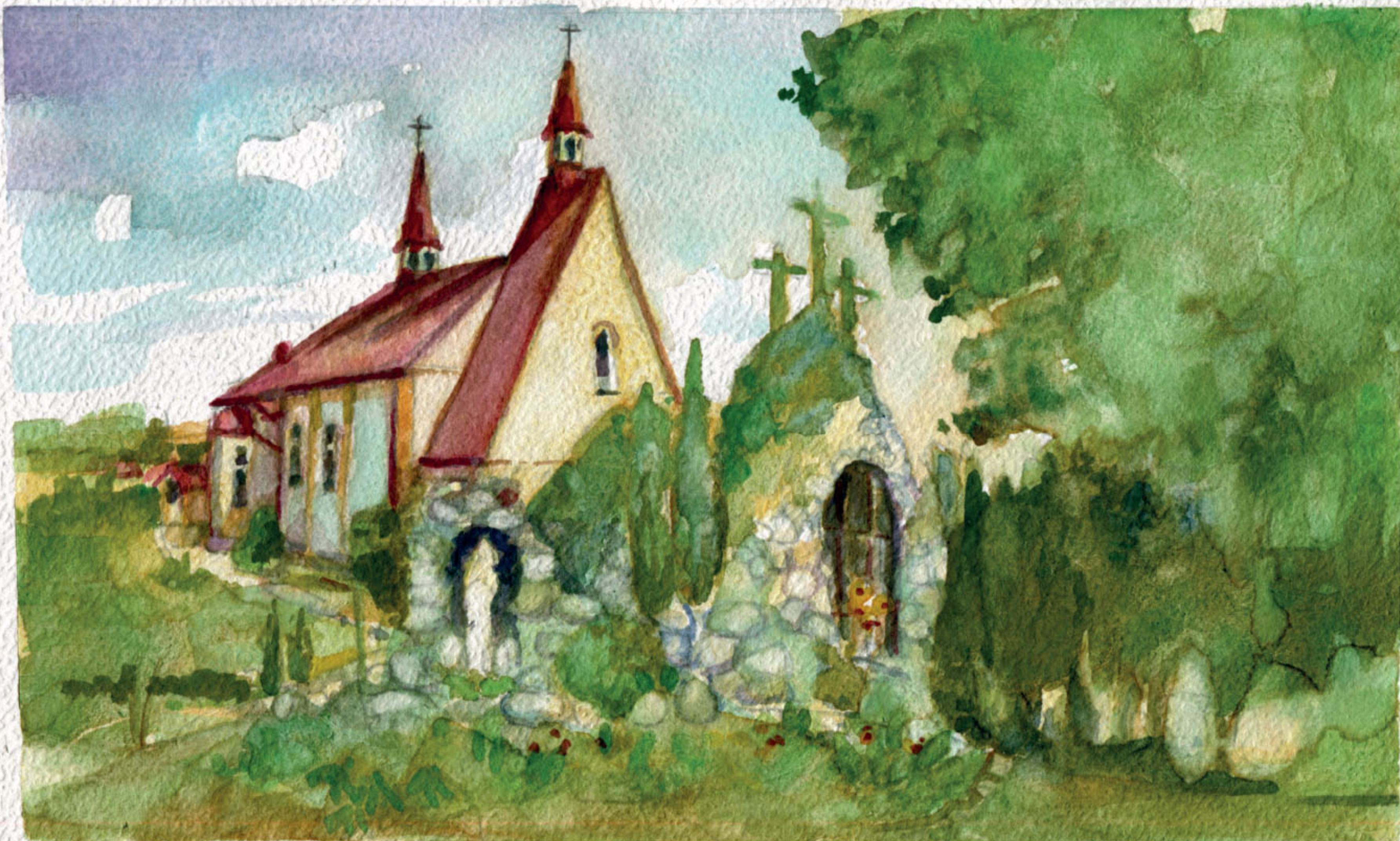
Sanktuarium NMP Królowej Serc Naszych i Ogród Różańcowy w Dąbrówkach